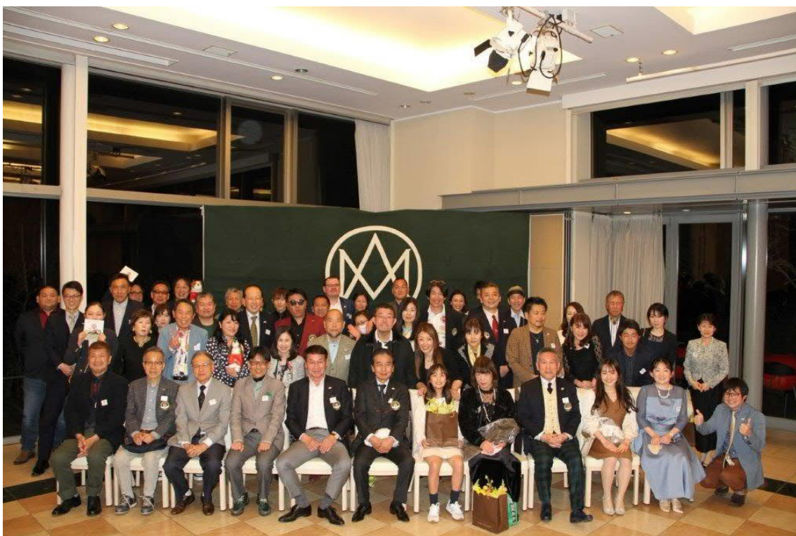
閉会のあいさつ、記念撮影を経て、今回の 2023 Spring Meeting は解散です。

今回の 2023 Spring Meeting は創設以来初の関西開催ということで、ロテルド比叡の雄大な自然環境、そして Aston Martin に囲まれた素晴らしい二日間でした。