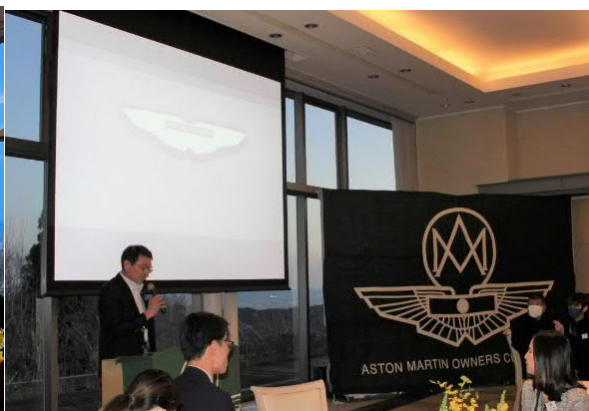
伊澤会長 代表あいさつ