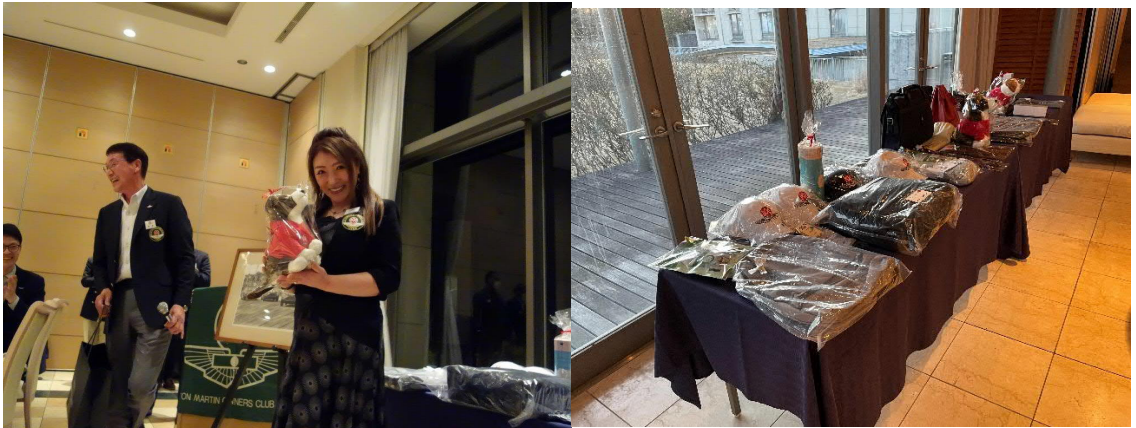
抽選会、豪華景品のご提供ありがとうございます。ご当選おめでとうございます。